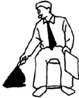
Jogai Fuera de límite