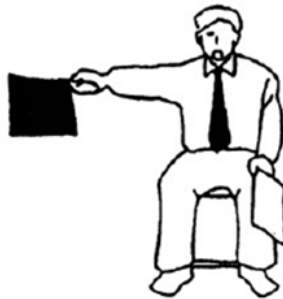
Waza-Ari Medio punto