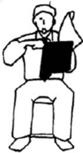
Ukete-Masu Ataque bloqueado