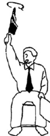
Hansoku Chui Amonestación previa a la descalificación