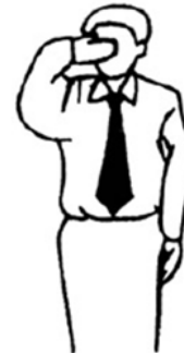
Muboubi No defiende