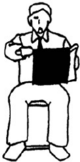
Hayai Ataque más veloz