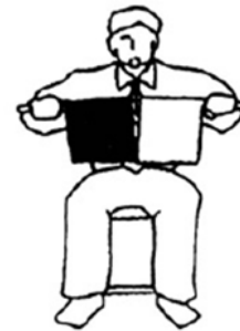
Aichi Ataque simultáneo