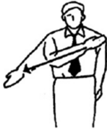
Waza-Ari Medio Punto