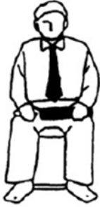
Yoi, Hajime Listo, empezar

Bandera oscura: Roja – Bandera clara: Blanca