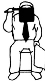
Muboubi No se defiende