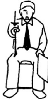
Yowai Ataque débil