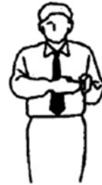
Hayai Ataque más rápido