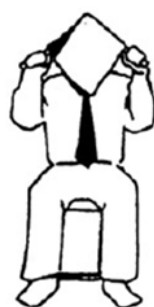
Mienai No puede ver