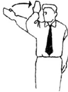
Shugo Llamado a consulta