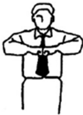
Aiuchi Ataque simultáneo