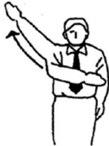
Ippon Un punto