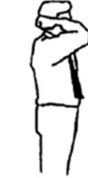
..... Nukete-Masu .....