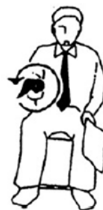
Keikoku Aviso o advertencia