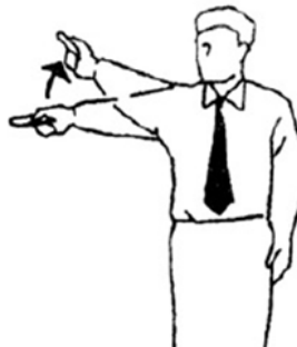
Shikkaku Descalificación total