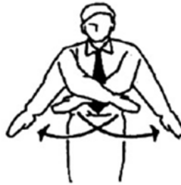
Torimasen Sin puntos