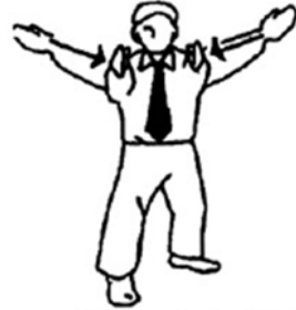
Tsuzukete Hajime Continuar