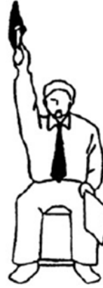
Ippon Un punto