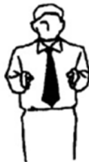
Maai Falta distancia