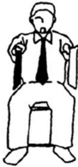
Maai Falta de distancia