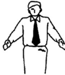
Moto No Ichi Regresar a posición