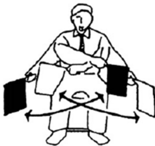
Torimasen Sin puntos