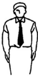
Shobu Ippon Hajime Comienzo