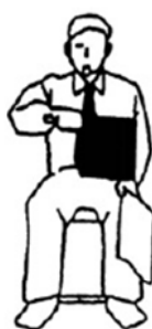
..... Nukete-Masu ..... .....Fuera del centro.....