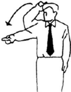
Jogai Fuera de límites